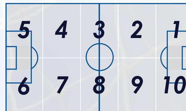
Schéma akce (pouze návrh)